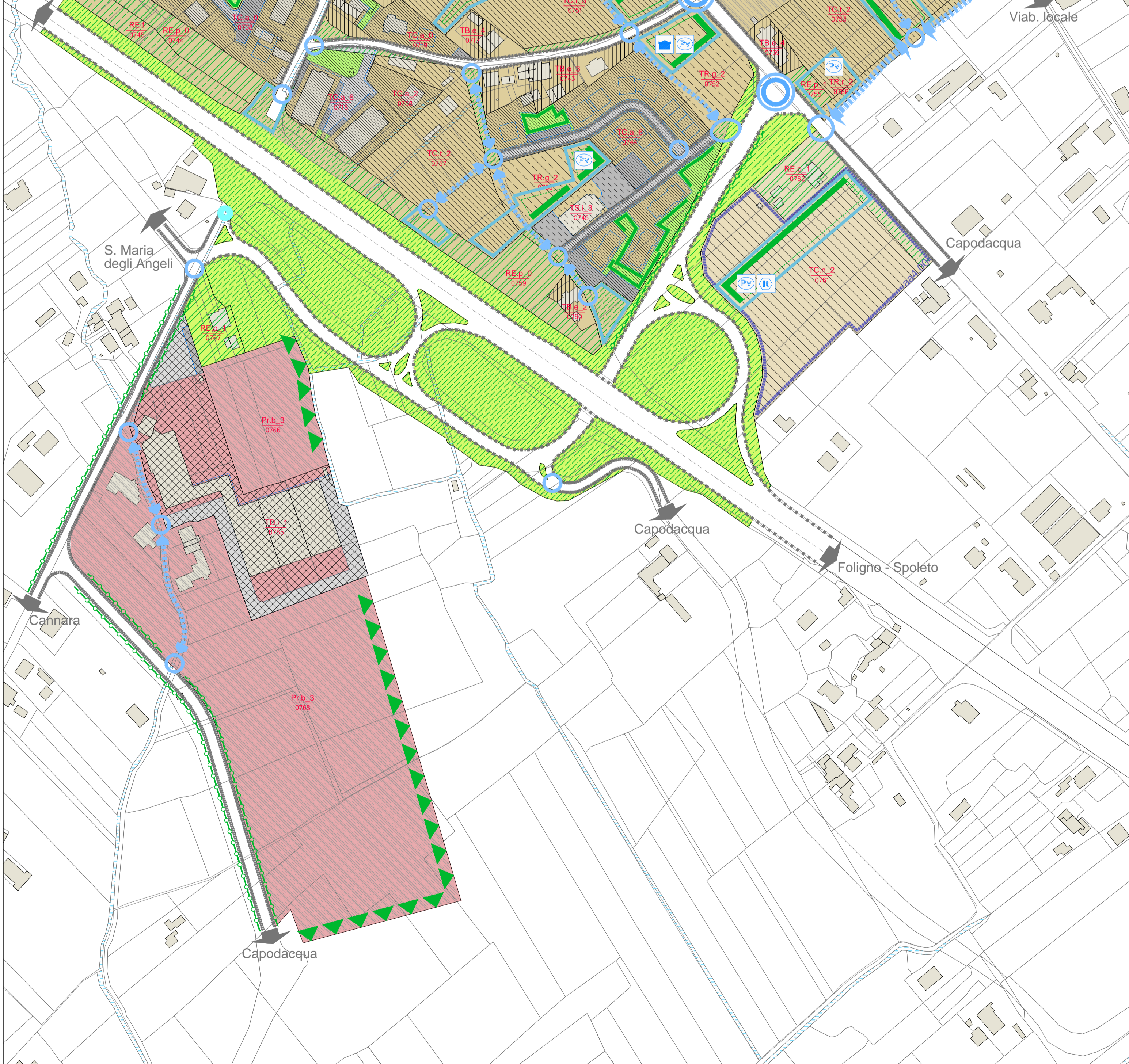
Ma.07 - RIVORTORTO - centro abitato/ Pr.08 - RIVORTORTO - Cimitero di guerra