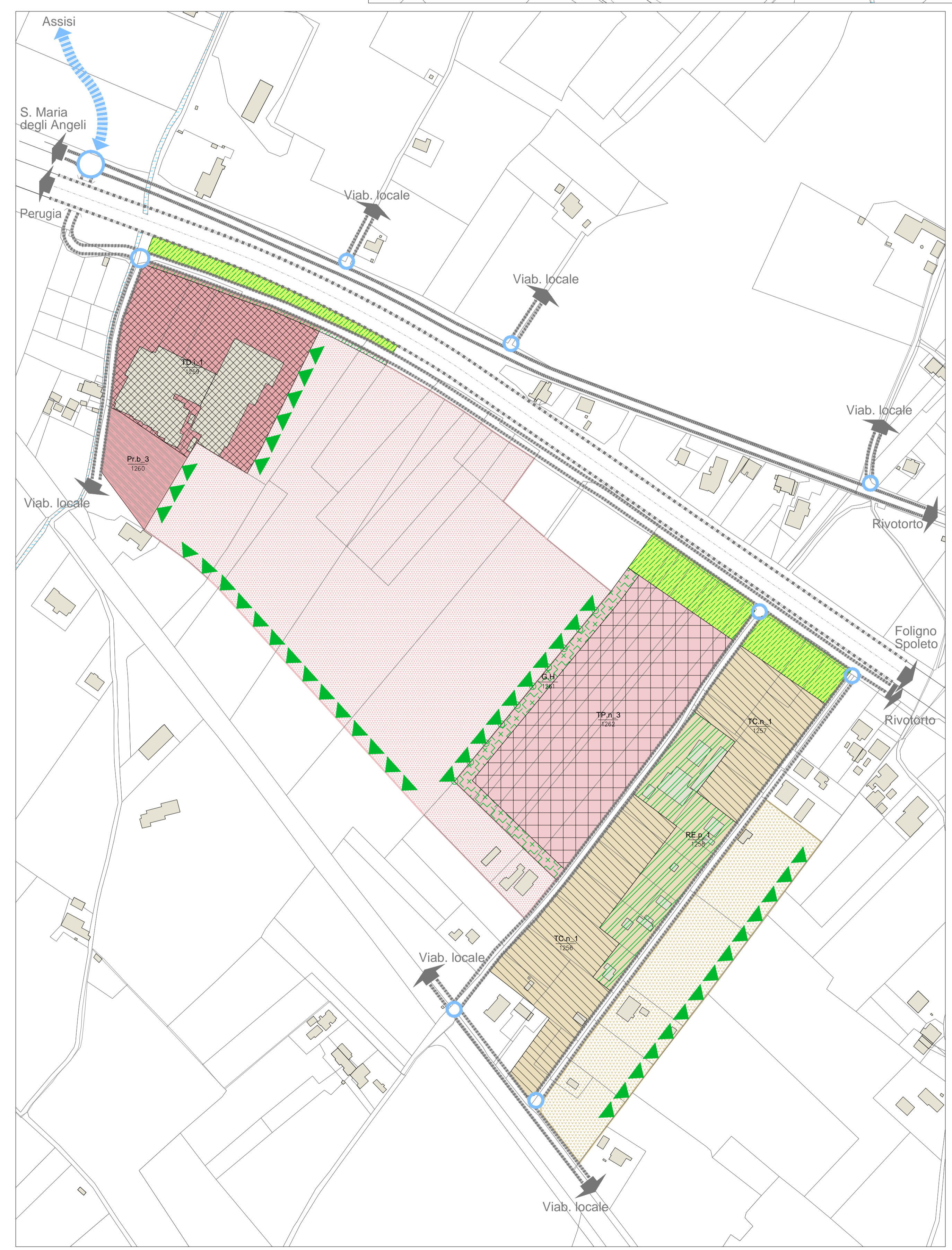
a - AF.21 - SANTA MARIA DEGLI ANGELI - loc. Pod.e Briziarelli/ AF.33 - LOC. CASE RAGNI