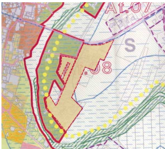
Allegato cartografico 1

La richiesta non si ritiene accoglibile nei termini contenuti nell'Osservazione (vedi Allegato cartografico 1); tenendo conto della più ampia problematica di riassetto urbanistico emersa per le aree poste tra il Ponte sul Chiascio oltre Petrignano e la direttrice per Palazzo si propone - in accoglimento parziale dell'istanza - di riconoscere parte delle aree indicate come Zone prevalentemente residenziali di nuovo impianto e parte come Zone di rispetto e ambiti di salvaguardia dei sistemi naturali e dei valori paesaggistici , considerando la richiesta di classificazione in continuità con le analoghe determinazioni espresse per le aree contermini (vedi determinazioni per le Osservazioni nn. 160, 191 e 198 – Allegato cartografico 2), al fine di riorganizzare in forma coerente questa parte dell'abitato di Petrignano; più in generale si verrà così ad individuare una Componente del sistema insediativo (unendo di fatto l'ambito Af.06 con l'ambito Af.07) che potrà essere specificatamente normata ai fini della riqualificazione urbanistica e che potrà prevedere le necessarie quantità insediative - fatte salve le specifiche condizionalità legate al rischio idraulico - da distribuire puntualmente anche entro le parti classificate come ambiti di salvaguardia, in concorso con le aree residenziali di nuovo impianto di nuova perimetrazione, nel quadro di un più esteso disegno di suolo.