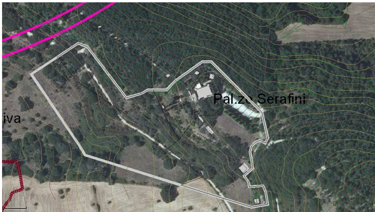
Allegato cartografico 2