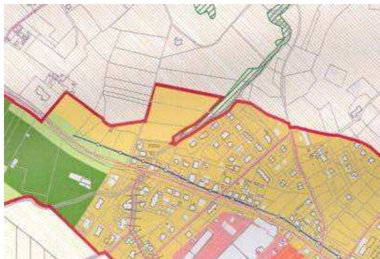
Allegato cartografico 1

SINTESI DELLA PROPOSTA DI CONTRODEDUZIONE: parzialmente accoglibile