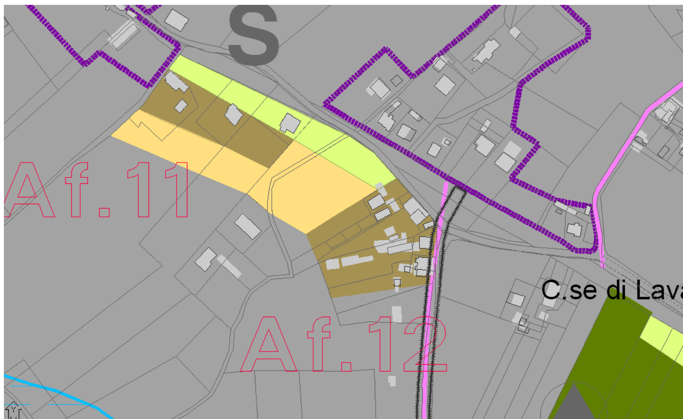
Allegato cartografico 2