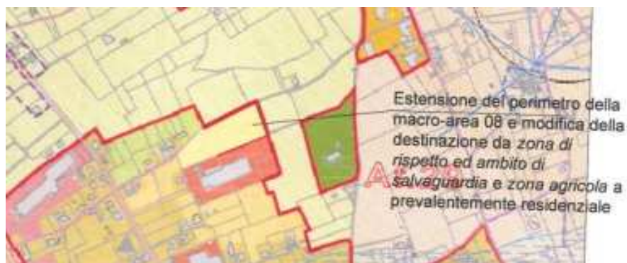
Allegato cartografico 1

SINTESI DELLA PROPOSTA DI CONTRODEDUZIONE: parzialmente accoglibile