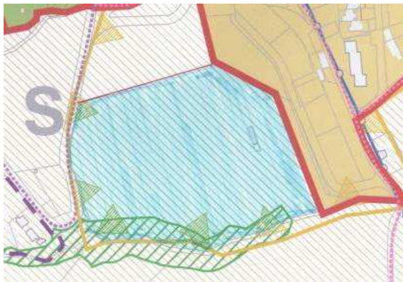
Allegato cartografico 1

SINTESI DELLA PROPOSTA DI CONTRODEDUZIONE: parzialmente accoglibile