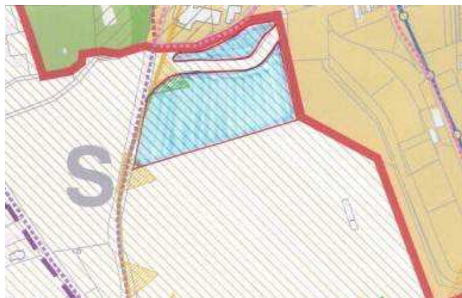
Allegato cartografico 1

SINTESI DELLA PROPOSTA DI CONTRODEDUZIONE: parzialmente accoglibile