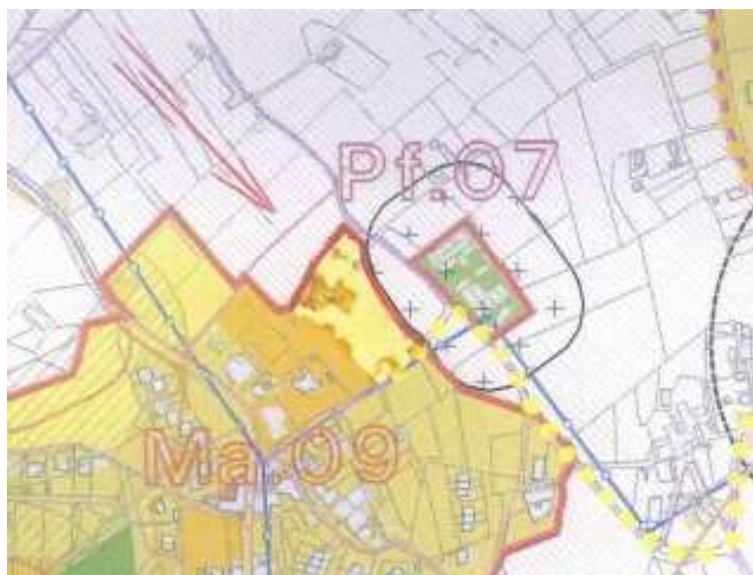
Allegato cartografico 1

SINTESI DELLA PROPOSTA DI CONTRODEDUZIONE: parzialmente accoglibile